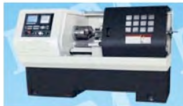
TORNO CNC INDUSTRIAL