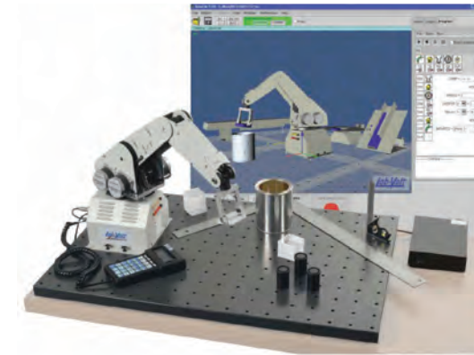
SISTEMA DE ENTRENAMIENTO EN ROBÓTICA DIDÁCTICO MODELO 5150