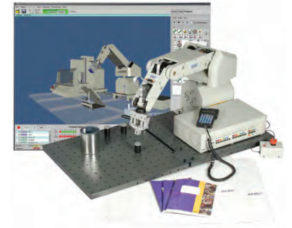
INDUSTRIAL MODELO 5250