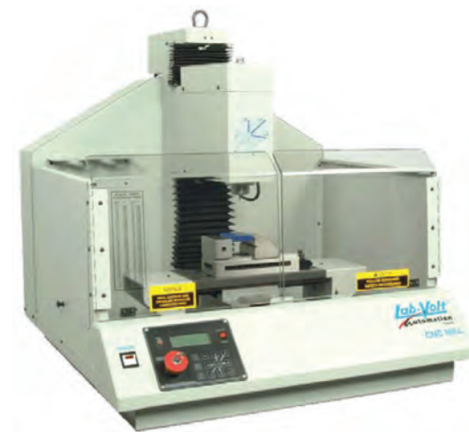
FRESADORA DIDÁCTICA CNC MODELO 5600