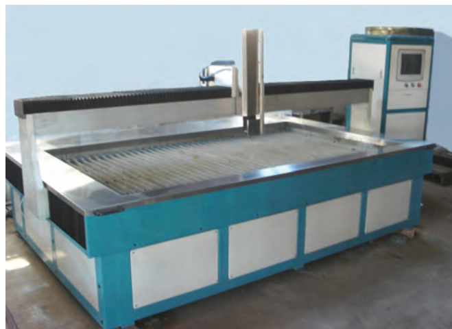
CORTADORA DE AGUA