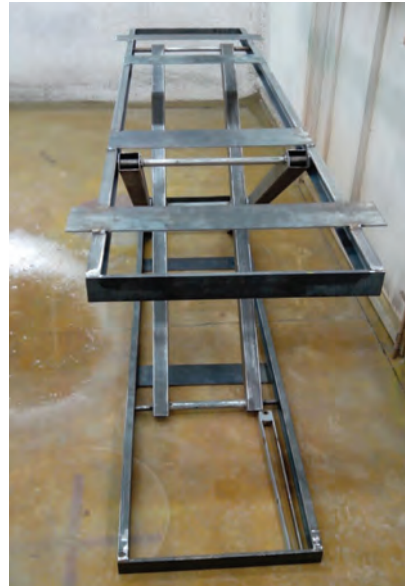
SISTEMA DE HERRERÍA HIDRÁULICA